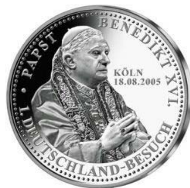
Par la frappe d'une médaille commémorative spéciale, la visite du Pape entre visiblement dans l'histoire.

Dieu nous est apparu uniquement et seulement en Jésus-Christ, Son Fils seul engendré, qui est mort pour nous, c'est-à-dire à notre place. Lui seul est le Chemin, la Vérité, la Vie et personne sur la terre ne vient «au Père céleste», qu'uniquement au travers de Son Fils seul engendré, par Lequel Il s'est révélé à nous, “... en qui nous avons la rédemption, la rémission des péchés...” (Col. 1.14). Le véritable témoignage des Saintes Ecritures doit être proclamé au monde entier au travers de l'Evangile